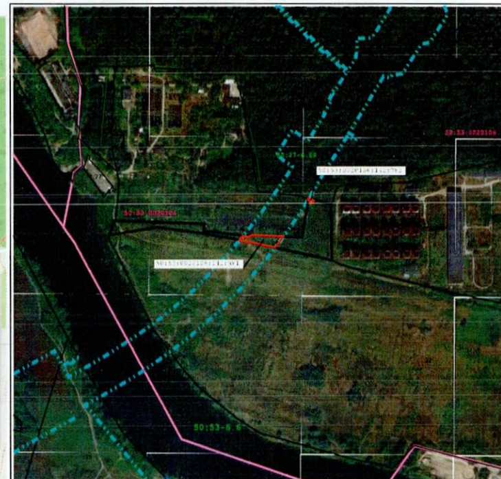
Масштаб 1:8 000