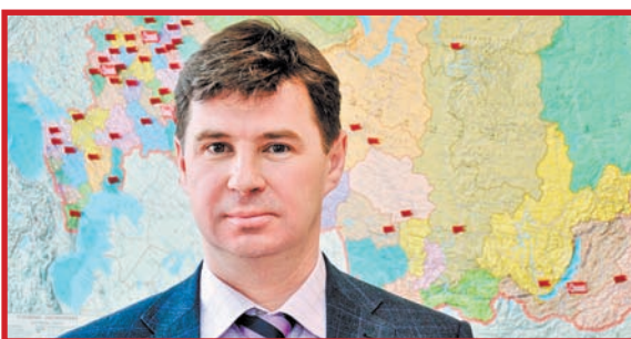
ЛЫТКАРИНО – НАШ ГОРОД...