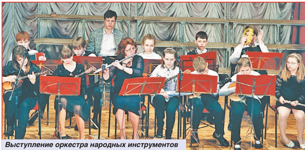
Выступление оркестра народных инструментов