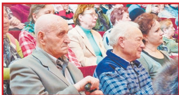
ПЛАТИТЬ ИЛИ... КАК ПЛАТИТЬ. ЧАСТЬ 4