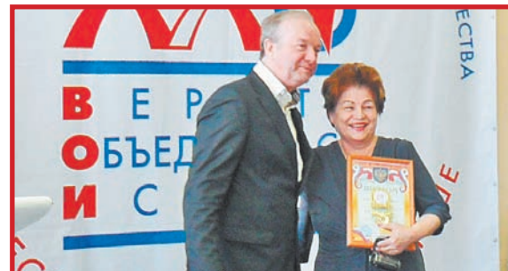
ИЗ КОЛОМНЫ С ПРИЗАМИ