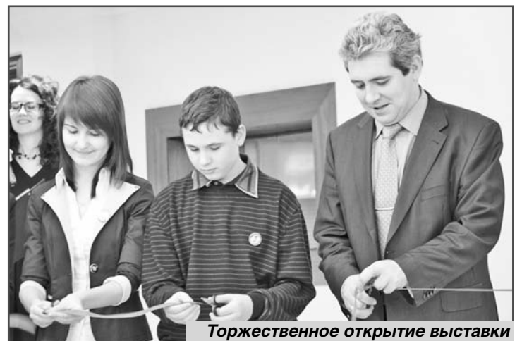
Торжественное открытие выставки

После торжественного открытия выставки и просмотра работ молодых дарований, для членов МАНЖ была организована экскурсия по зданию Думы и ознакомление с ее работой. Помимо того в зале совещаний «Единой России» для начинающих журналистов была проведена пресс-конференция с участием руководителей разных комитетов. Молодые журналисты задавали немало вопросов, но более всего их волновал процесс обязательного тестирования на наркотики в учебных заведениях, какая поддержка оказывается способным юношам и девушкам