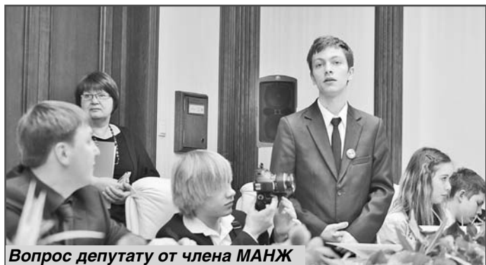
Вопрос депутату от члена МАНЖ

Нина КОЗЕРОД, специальный корреспондент.