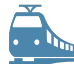
Железнодорожные пути необщего пользования